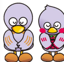
埼玉県マスコット 「コバトン＆さいたまっち」