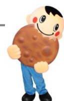
草加市キャラクター 「バリボリくん」