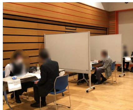
※合同企業面接会の様子