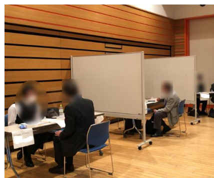
※合同企業面接会の様子