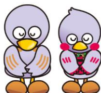
埼玉県マスコット 「コバトン&さいたまっち」