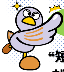
埼玉県のマスコット 「コバトン」