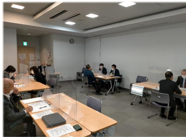
※写真は合同企業面接会の実施状況です。