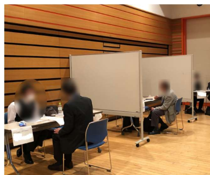
※合同企業面接会の様子