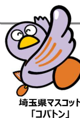
埼玉県マスコット 「コバトン」