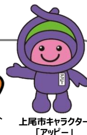
上尾市キャラクター 「アッピー」