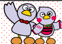
埼玉県のマスコット 「コバトン&さいたまっち」