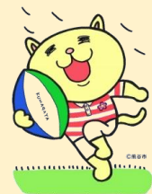
熊谷市マスコットキャラクター 「ニャオざね」