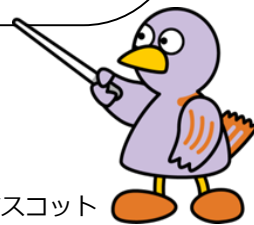
埼玉県のマスコット 「コバトン」