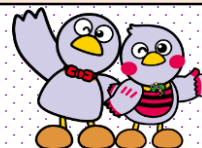
埼玉県のマスコット 「コバトン&さいたまっち」