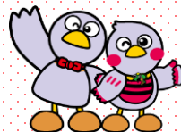
埼玉県のマスコット 「コバトン&さいたまっち」