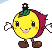
川越市マスコットキャラクター「ときも」