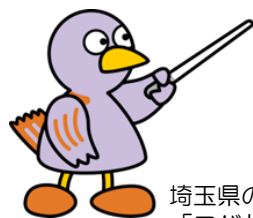
埼玉県のマスコット 「コバトン」