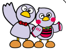
埼玉県マスコット 「コボタン&さいたまっち」