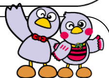
埼玉県マスコット 「コバトン&さいたまっち」