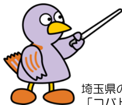
埼玉県のマスコット 「コバトン」