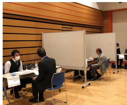
※合同企業面接会の様子