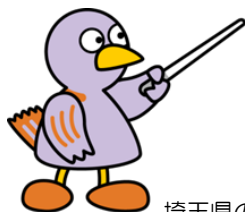
埼玉県のマスコット 「コバトン」