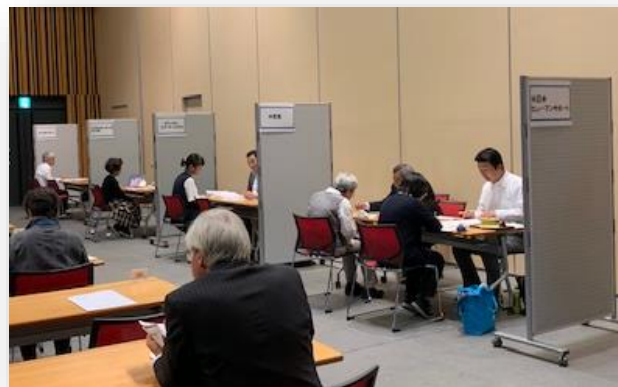
※写真は令和元年8月の実施状況です。