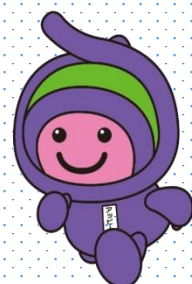
上尾市マスコットキャラクター 「アッピー」