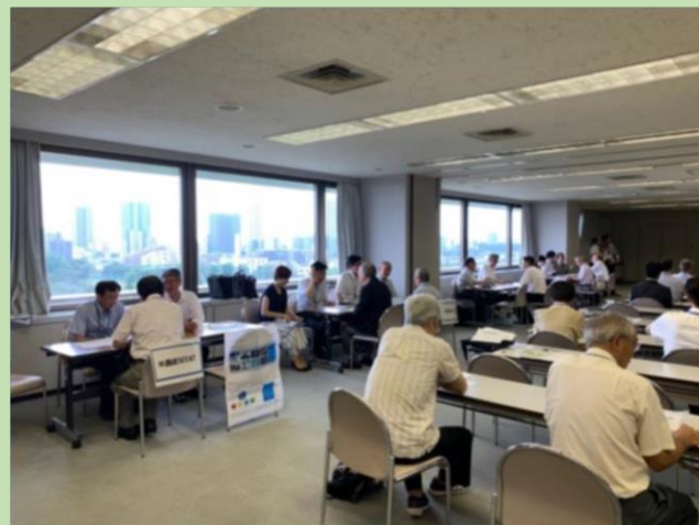
※写真は昨年度の実施状況です。