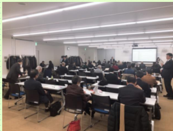
※写真は昨年度の実施状況です。