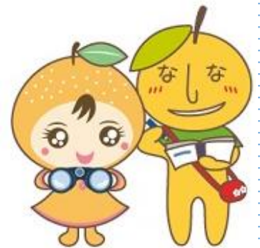
白岡市マスコットキャラクター 「なしりん・なしべえ」