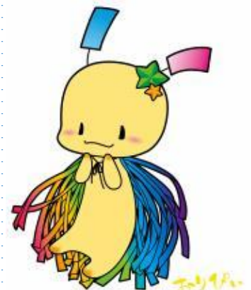
狭山市 七夕の妖精 「おりぴい」