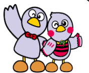
埼玉県マスコット「コバトン&さいたまっち」