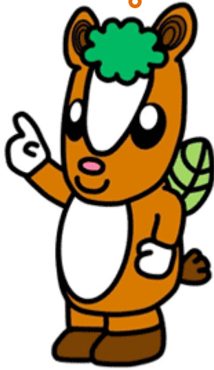
飯能市マスコットキャラクター「夢馬（ムーマ）」