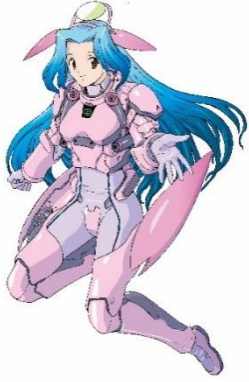
志木市観光PRキャラクター 「いろは水輝」 © 志木市（松浦まさふみ画）