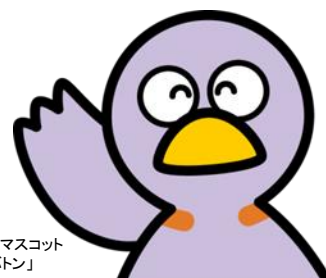
埼玉県のマスコット 「コバトン」

自分自身を理解し、相手に自分の伝えたい ことを、はっきり伝えられるための会話術。