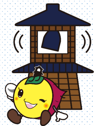
川越市マスコットキャラクター 「ときもち」