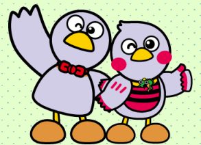
埼玉県のマスコット 「コバトン&さいたまっち」