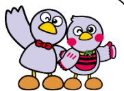
埼玉県マスコット「コバトン&さいたまっち」